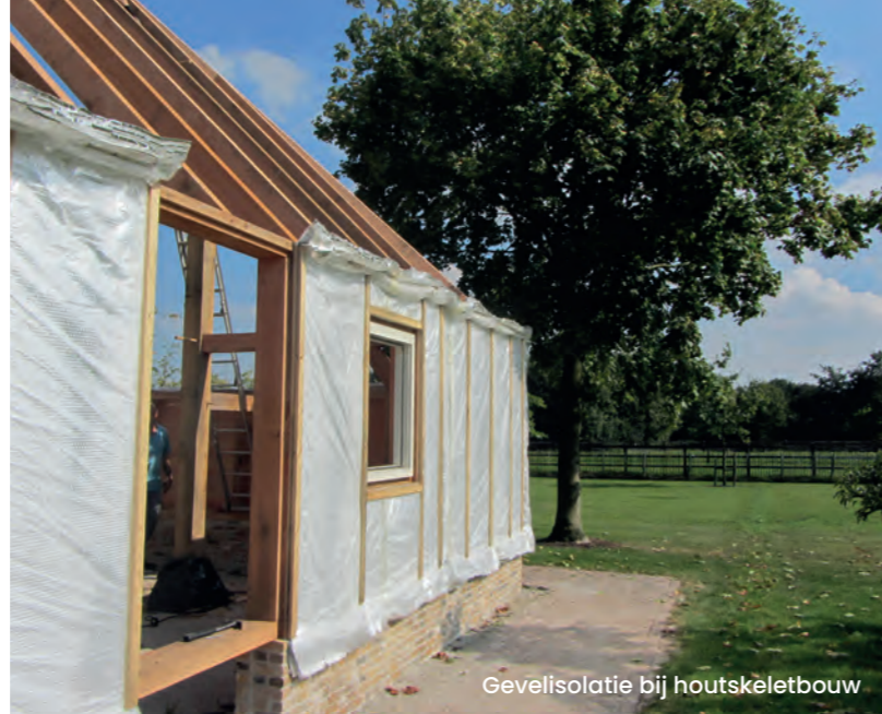
Gevelisolatie bij houtskeletbouw