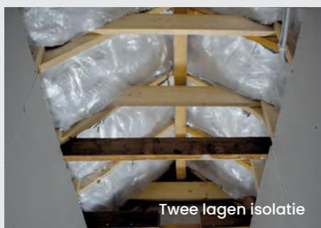
Twee lagen isolatie

Isobooster Professional is onze meest robuuste lijn die voldoet aan de hoogste waarden. Sinds 2021 is het product voorzien van de BCRG-Kwaliteitsverklaring. We zien dat hiermee zelfs monumenten op het hoogste isolatieniveau conform NTA8800 worden gebracht.