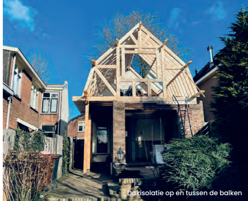
Dakisolatie op en tussen de balken