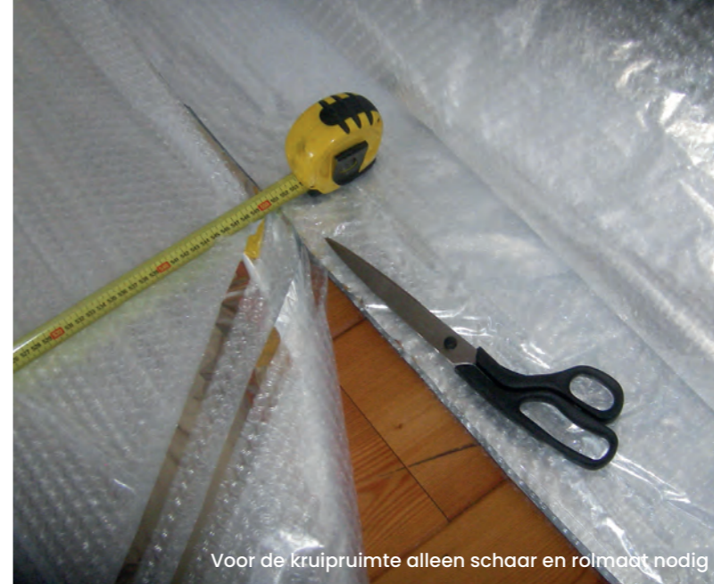
Voor de kruipruimte alleen schaar en rolmaat nodig

E. van de Beek | B&B Vastgoedontwikkeling