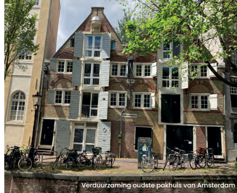
Verduurzaming oudste pakhuis van Amsterdam