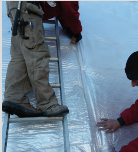
Banen onderling vastzetten met tape