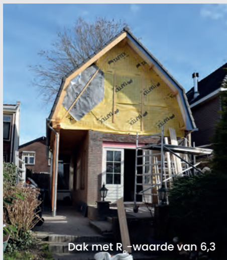
Dak met R w -waarde van 6,3