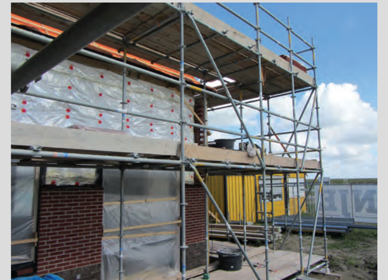
Spouwisolatie bij nieuwbouwwoningen

Isobooster wordt standaard geleverd op rollen van 1200 mm en 600 mm. Door de ingebouwde overlap van 50 mm monteert je snel banen naast of onder elkaar met naadloze aansluitingen. Met de speciale Isobooster tape worden de banen aan elkaar vastgezet. Je kunt Isobooster knippen of snijden met een schaar of mes. Isobooster wordt geleverd in een beschermende verpakking.