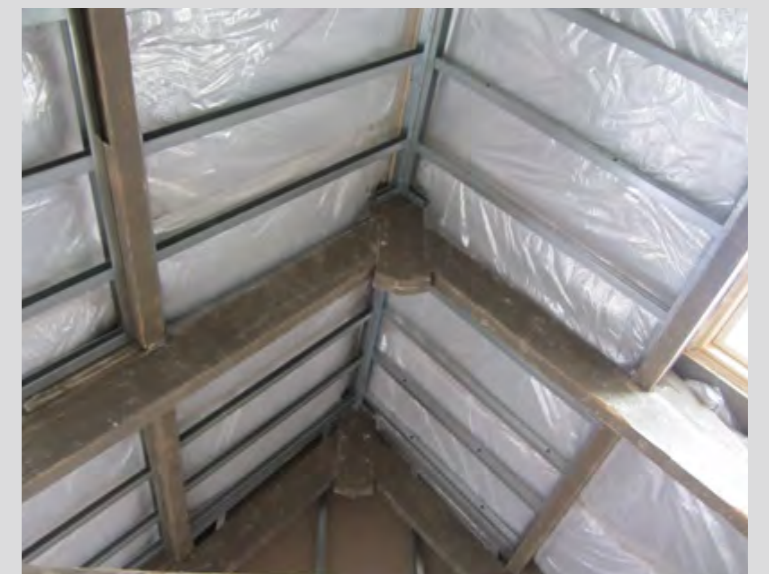
Bij dakisolatie met metalstud blijven authentieke dakbalken zichtbaar