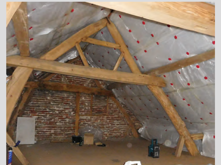
Verduurzaming van historische vakwerk kap