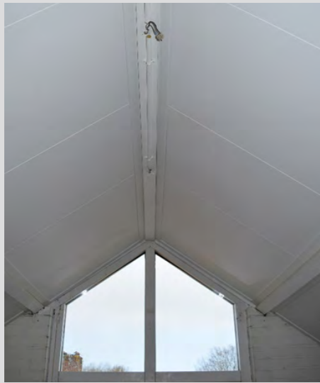
Zolders in één dag isoleren met het Isobooster Hellend dak Systeem (HDS)