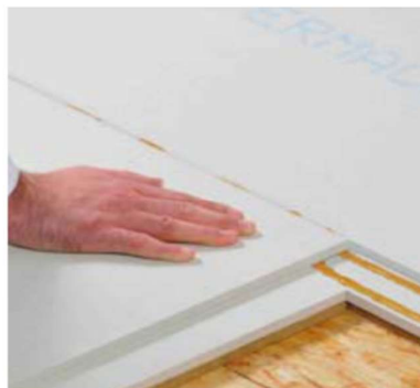
Verlijmen van de vloerelementen onderling met volledig met lijm gevulde liplas